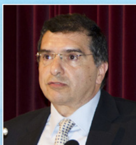
ΒΑΣΙΛΕΙΟΣ Α. ΒΡΕΤΤΟΣ Υποδιοικητής Διαχείρισης Αερολιμένων και Υδατοδρομίων, ΥΠΑ

Στο panel θα συμμετάσχουν οι ακόλουθες προσωπικότητες από το φάσμα του επιχειρηματικού οικοσυστήματος των αερομεταφορών με υδροπλάνα στην Ελλάδα: